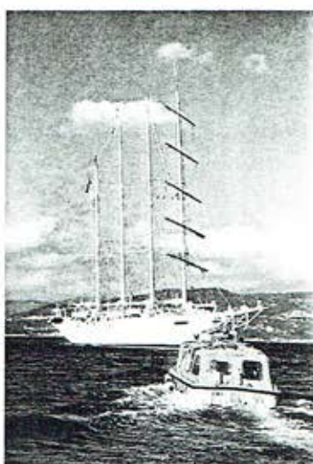
Met tenders van Hollandse makelij worden de passagiers en bemanning van de „Star Flyer” naar en van de wal gebracht.