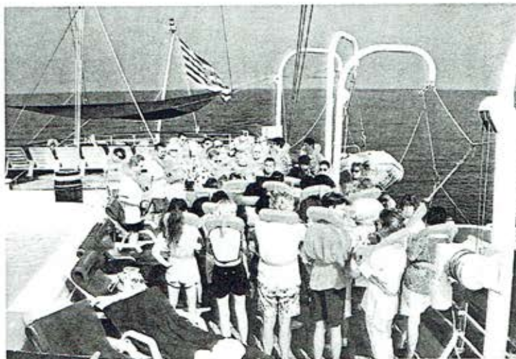
Sloepenrol met op de achtergrond de koopvaardijvlag van Luxemburg.

De volgende ochtend waren we in Porto Cervo, Sardinië, waar grote jachten lagen afgemeerd. Het plaatselijke winkelcentrum biedt dan ook onderdak aan luxueuze winkels, vaak met zeer exclusieve mer-