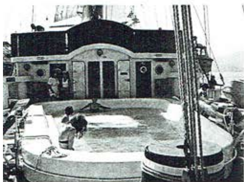
Eén van de twee zwembaden.

De Oekraïense scheepstuiger Anatoly – qua uiterlijk het toonbeeld van de onverschrokken stoere zee-man – stal de show toen hij vanuit een bootmansstoeltje in de top van de mast (ca. 65 m hoog) de rederij-vlag uit de plooi haalde. Zijn stunt werd beloond met een daverend ap-